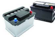
Tractie- en autobatterijen