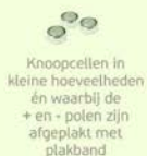
Knoopcellen in kleine hoeveelheden én waarbij de + en - polen zijn afgeplakt met plakband