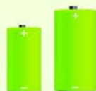
C- en D-batterijen